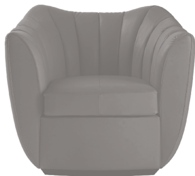
Icone Poltrona Frau Icons

Alla metà degli anni '30 Guglielmo Ulrich propone, in numerosi arredamenti di case alto-borghesi, modelli di poltrone "a pozzetto ingrandito" dove sperimenta una nuova forma di schienale che rinuncia alla separazione tra parte posteriore e braccioli. Un'unica sagoma avvolgente si caratterizza per la pronunciata imbottitura a fasce verticali. Il comfort, in modo del tutto inedito per l'epoca, assume un'importanza crescente.